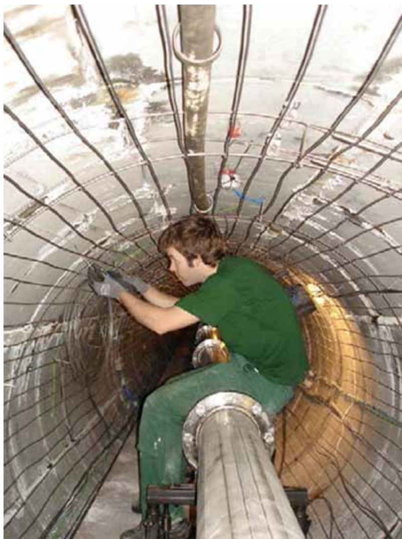
Installation av fiberoptiskt övervakningssystem i ett av MoDeRns projekt.

Wene säger att mätningar även kan utnyttjas för driftorganisationen som en del i ordinarie kontrollprogram. Fel kan upptäckas och åtgärdas under de närmare 80 år som det kommer att krävas för att