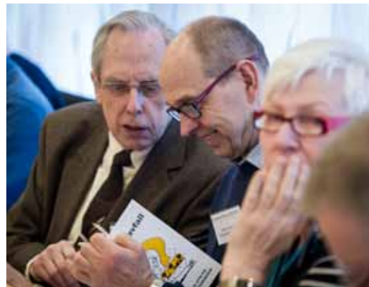
Engagerade deltagare i publiken vid Kärnavfallsrådets seminarium.

också för ett EU-projekt som utfördes mellan 2009 och 2013 och som uppmärksammar behov av att övervaka förslutna delar av slutförvaret genom att utveckla ett mätprogram.